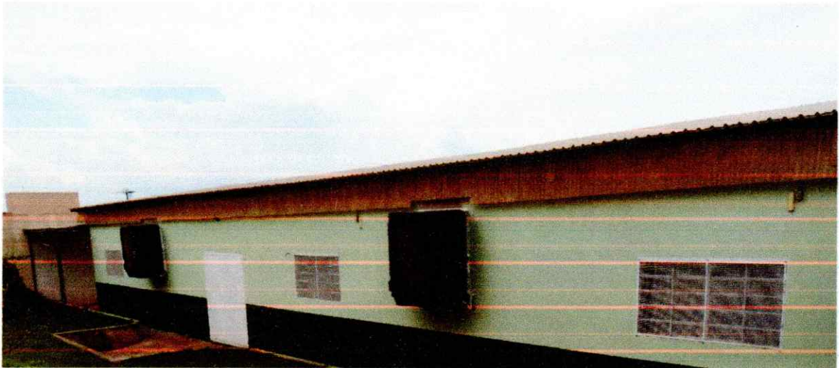
JANELAS NA PARTE EXTERNA DO SALÃO