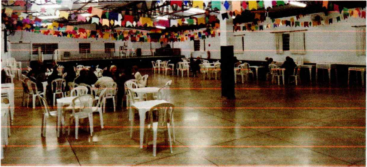
JANELAS NA PARTE INTERNA DO SALÃO